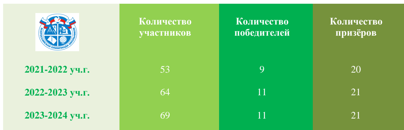
Таблица 13. Результаты участия в муниципальном этапе олимпиады